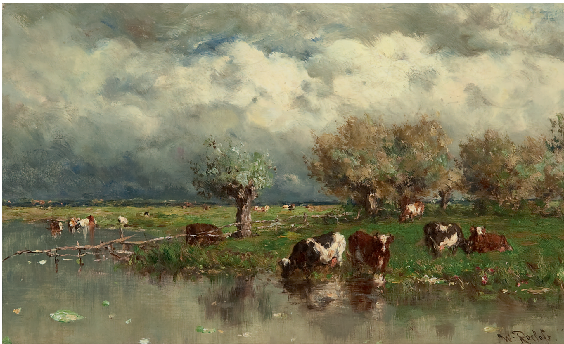
Willem Roelofs Waterlandschap met wadende koeien