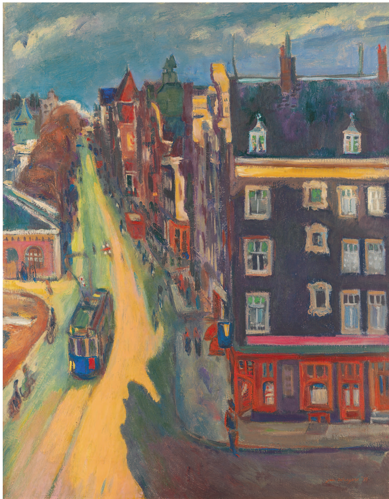
Jan Wiegers De Geldersekade in Amsterdam

Met echtheidsverklaring van dr. Manfred Reuther, Stiftung Seebüll Ada und Emil Nolde, Seebüll, Duitsland, 16 december 2005.