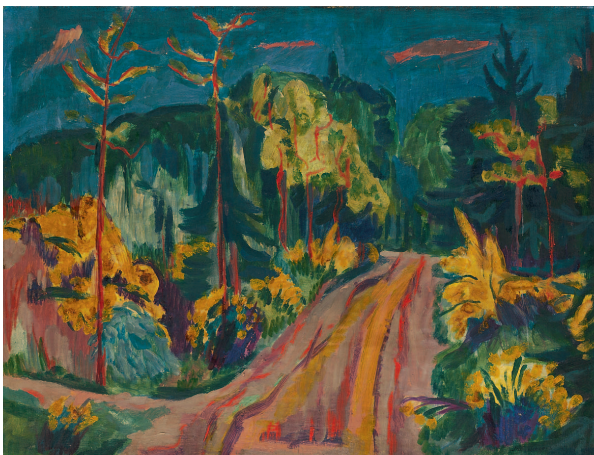
Jan Wiegers Landschap in de bergen

'Wat een harmonie van Hollandse expressionisten uit Friesland, Groningen en Bergen.'