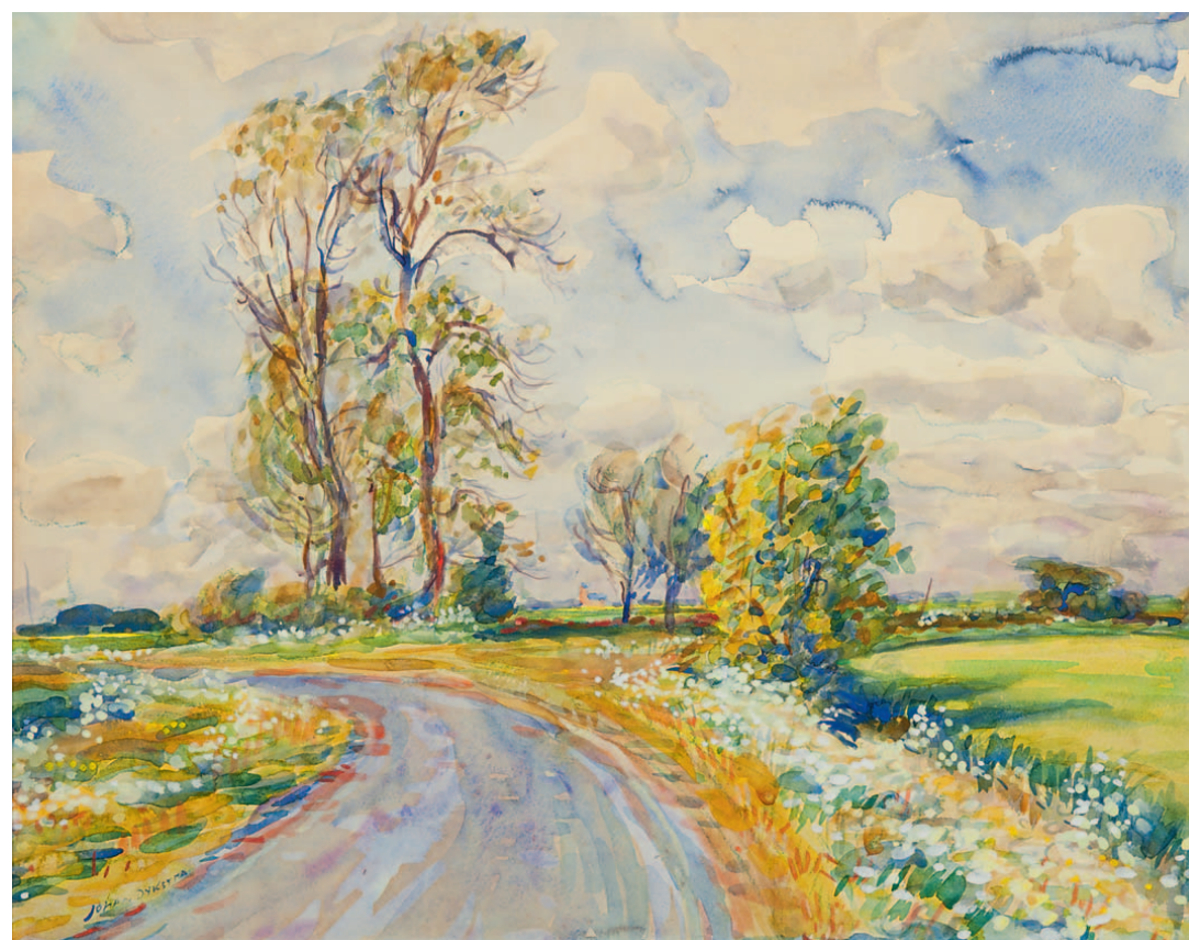
Johannes 'Johan' Dijkstra Landschap bij Ten Post