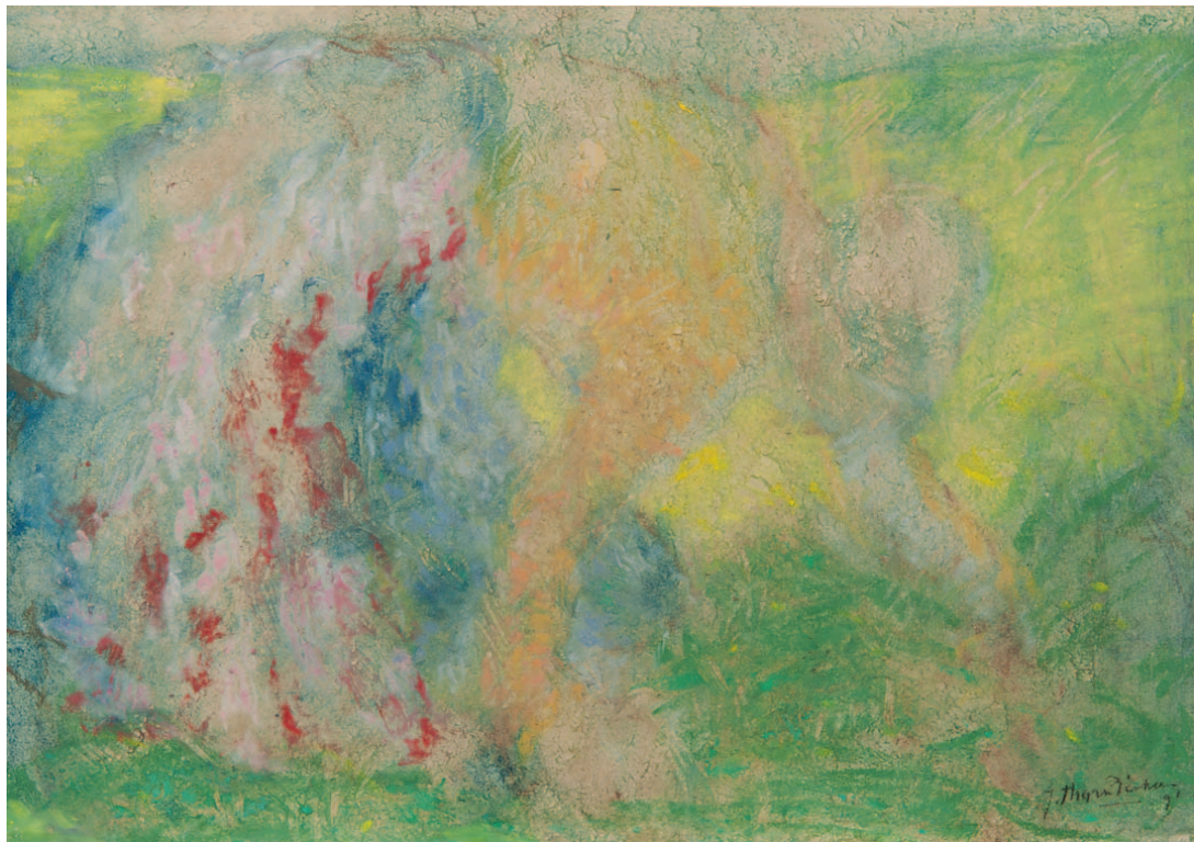
Johan Thorn Prikker Werken op het land