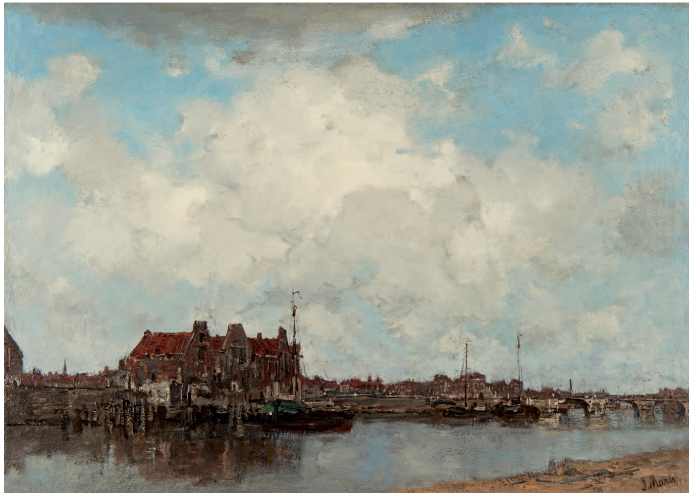
Jacobus Hendricus 'Jacob' Maris Stad aan het water

'Bij dit schilderij moet ik altijd denken aan Vermeer, alhoewel het er niets mee te maken heeft. Maris sprak over de Hollandse luchten als volgt: 'Ik schilder ze beter'. Hij bedoelde: ...dan de natuur.'