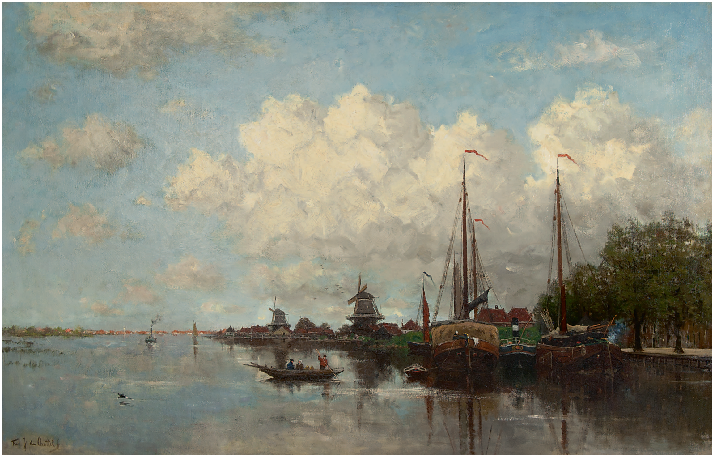
Fredericus Jacobus van Rossum du Chattel Gezicht op havenkade