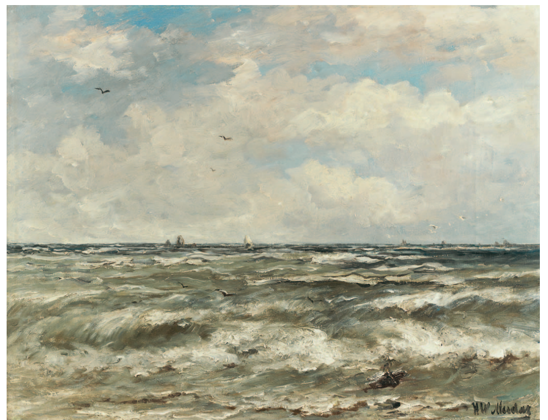
Hendrik Willem Mesdag Op open water

Hendrik Willem Mesdag Groningen 1831-1915 Den Haag Vissers bij bomshuit op het strand , olie op papier 20,8 x 28,2 cm, te dateren ca. 1868. Herkomst: geschenk van de schilder aan de grootmoeder van de vorige eigenaar.