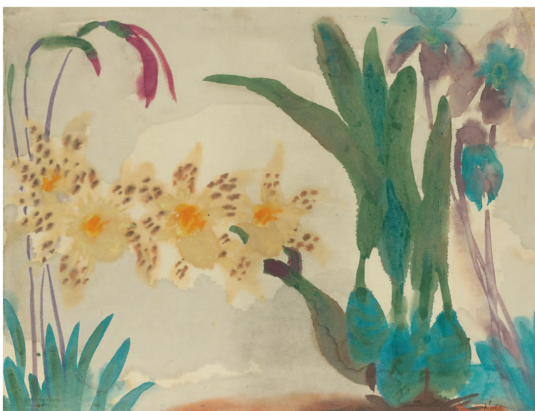
Hans 'Emil' Nolde (Hans Emil Hansen) Orchideeën