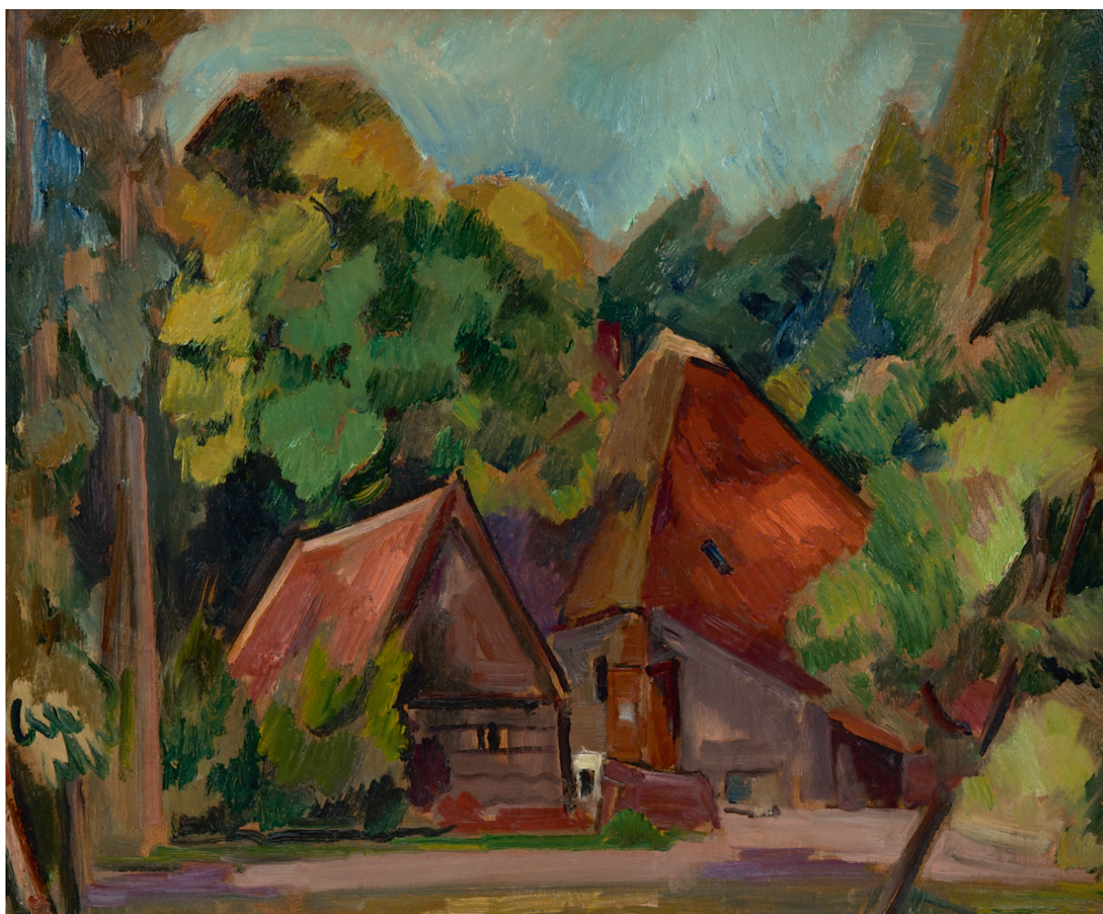
Mattheus Johannes Marie 'Matthieu' Wiegman Boerderij

'Wat een harmonie van Hollandse expressionisten uit Friesland, Groningen en Bergen.'