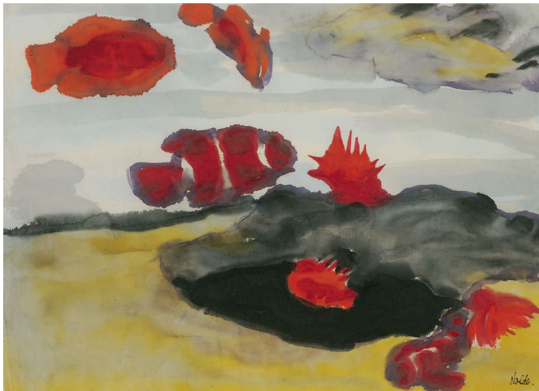
Hans 'Emil' Nolde (Hans Emil Hansen) Koraalvissen en zeeanemonen