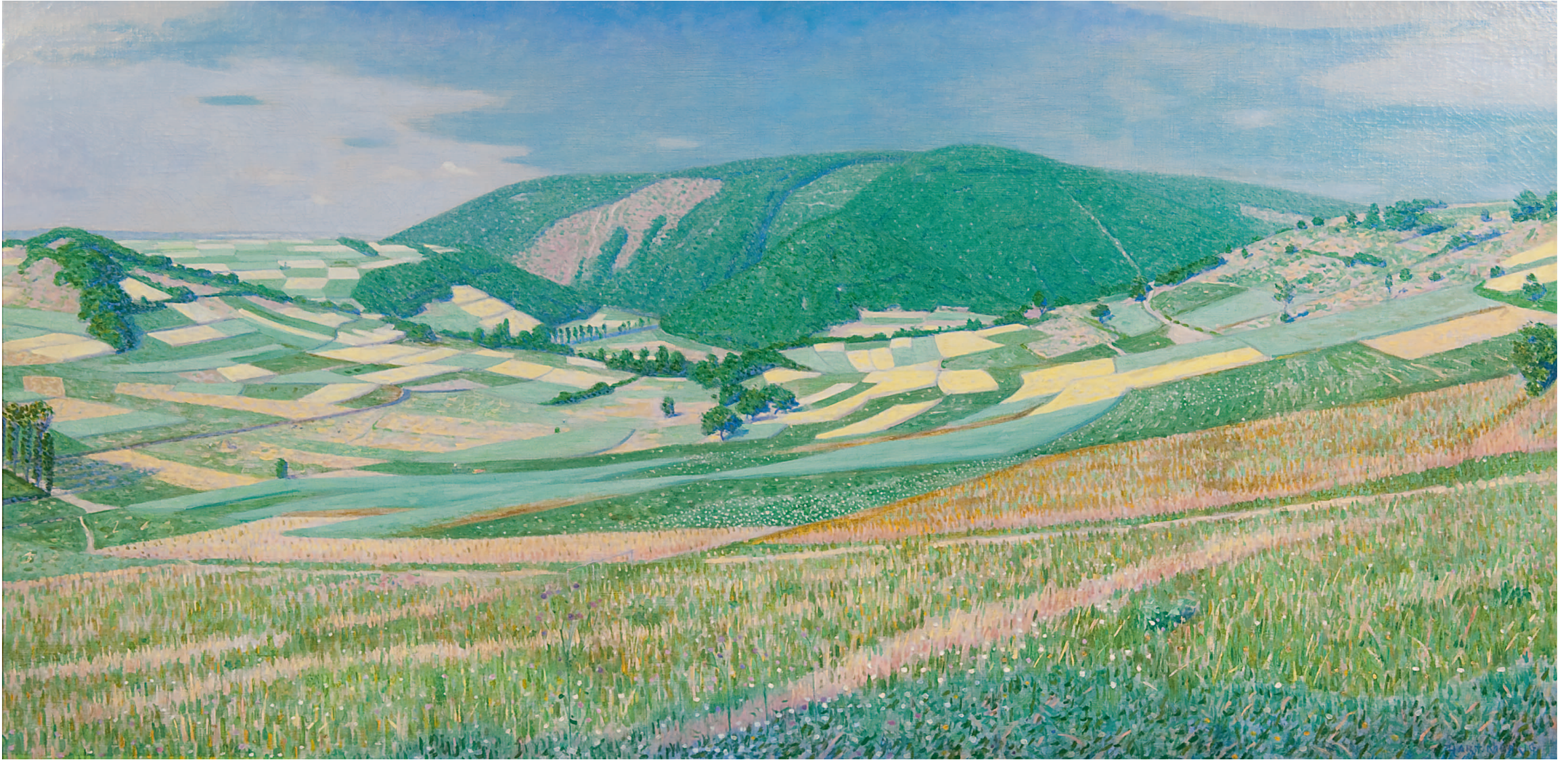
Ferdinand Hart Nibbrig In de Eifel

'Hart Nibbrig staat bekend om zijn vergezichten in het Gooi, Zoutelande en de Eifel. Het landschap spreekt voor zich. Het panorama van deze schilder in het Kröller-Müller Museum doet er niet voor onder.'