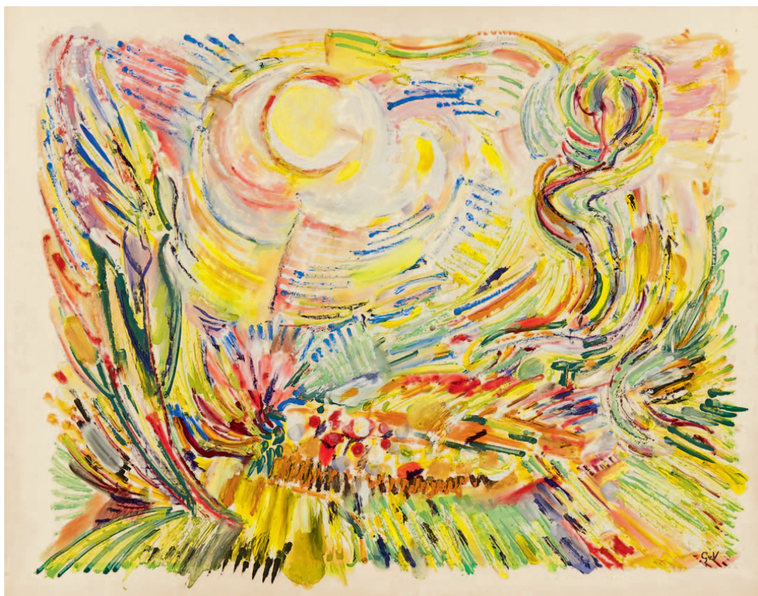
Gerardus 'Geer' van Velde Landschap met zon