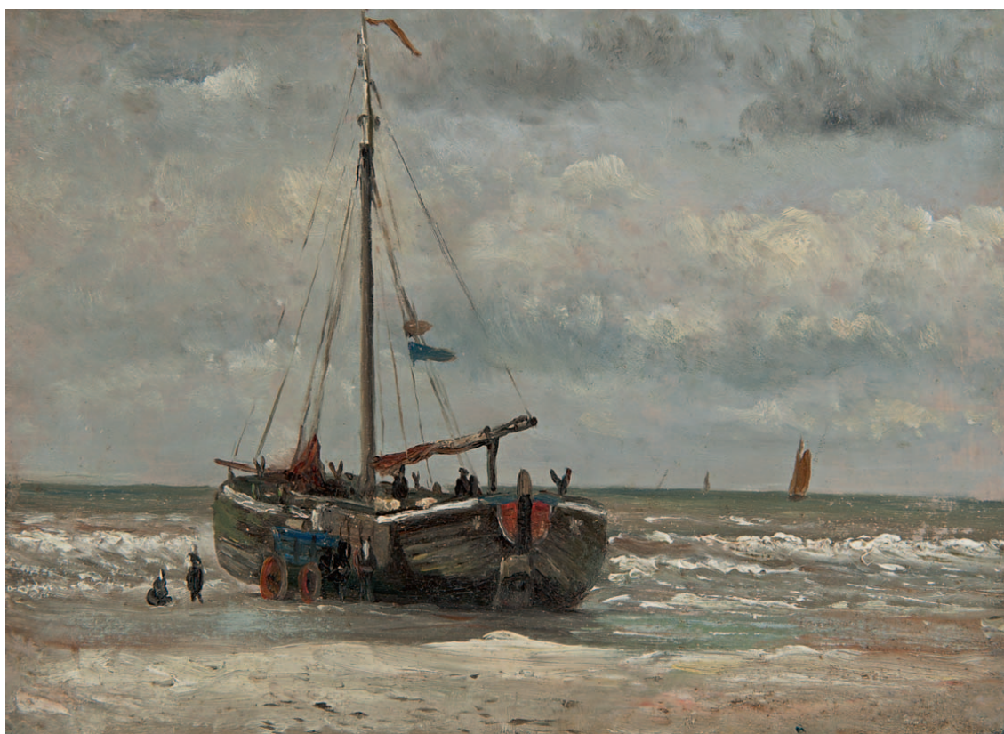
Hendrik Willem Mesdag Vissers bij bomshuit op het strand

'Een voorbeeld dat Mesdag een laatbloeiër was. Dit schilderij heeft iets primitiefs, iets gekunstelds. Het is aangenaam om naar te kijken, en je ziet er de vertolker van het Hollandse strand- en zeegezicht in.'